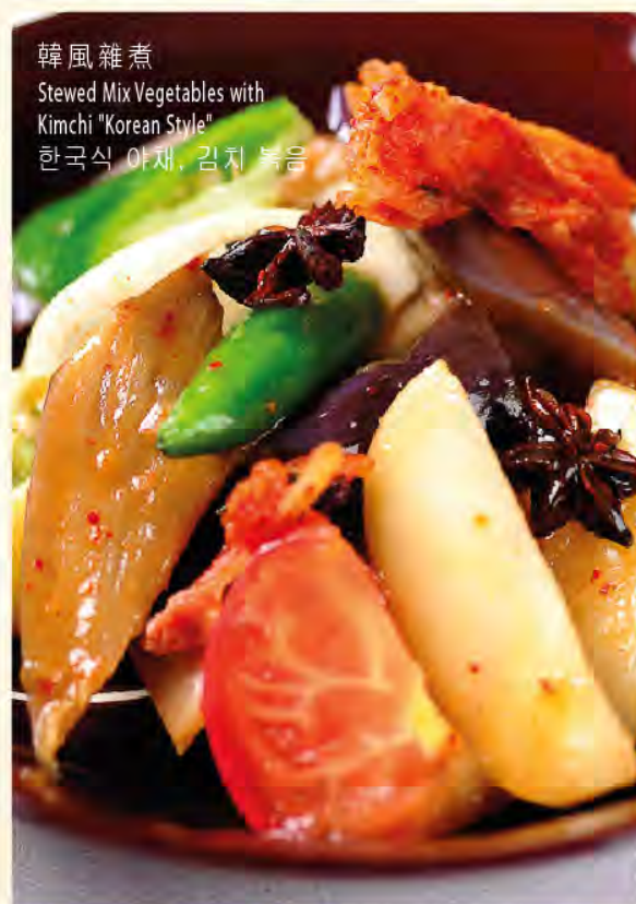
韓風雜煮 Stewed Mix Vegetables with Kimchi "Korean Style" 한국식 야채, 김치 볶음

以上價格為澳門幣並需另加10%服務費 All prices are in MOP and subject to 10% service charge 모든 금액은 마카오 달러이며 10%의 봉사료가 추가 됩니다.