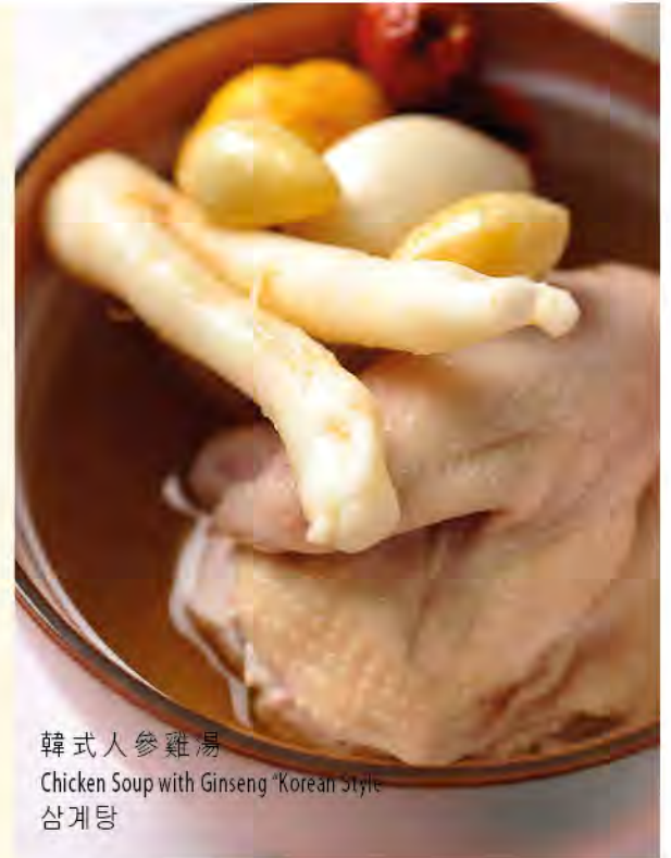
韓式人參雞湯 Chicken Soup with Ginseng "Korean Style" 삼계탕