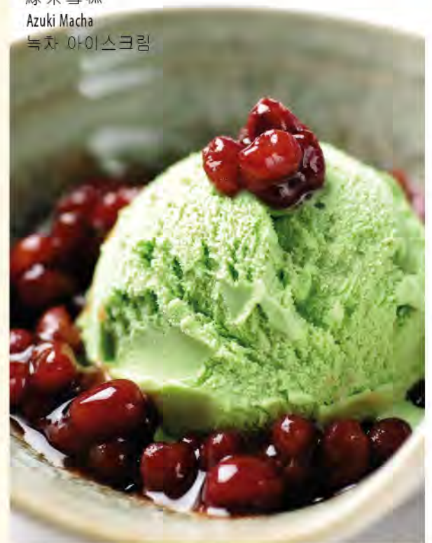
綠茶雪糕 Azuki Macha 녹차 아이스크림

以上價格為澳門幣並需另加10%服務費 All prices are in MOP and subject to 10% service charge 모든 금액은 마카오 달러이며 10%의 봉사료가 추가 됩니다.