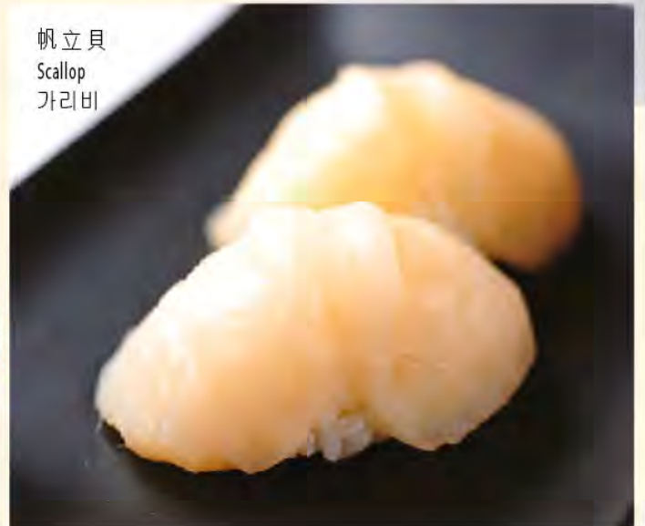
帆立貝 Scallop 가리비