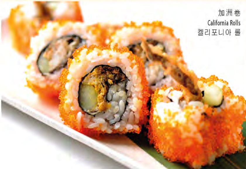
加洲卷 California Rolls 캘리포니아 롤

以上價格為澳門幣並需另加10%服務費 All prices are in MOP and subject to 10% service charge 모든 금액은 마카오 달러이며 10%의 봉사료가 추가 됩니다.