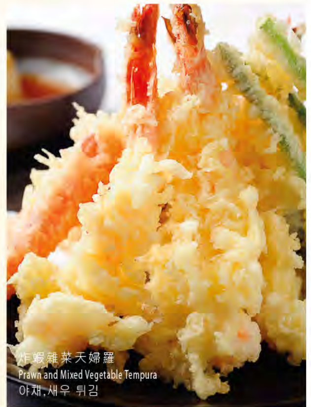
炸蝦雜菜天婦羅 Prawn and Mixed Vegetable Tempura 야채, 새우 튀김