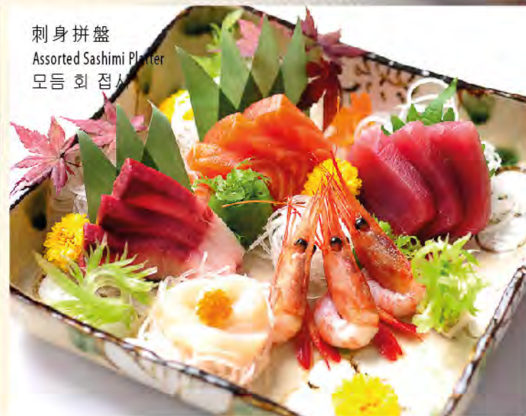
刺身拼盤 Assorted Sashimi Platter 모듬 회 접시