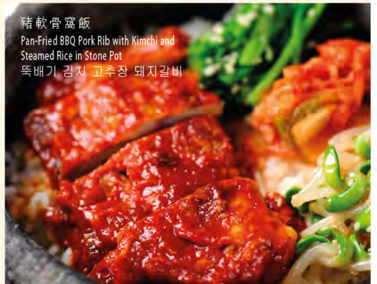
豬軟骨窩飯 Pan-Fried BBQ Pork Rib with Kimchi and Steamed Rice in Stone Pot 족배기 김치 고추장 돼지갈비