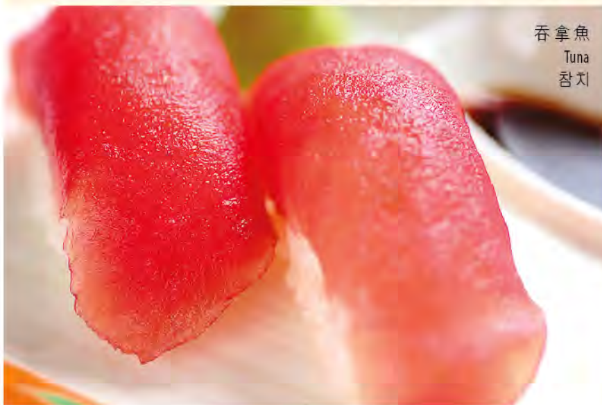
吞拿魚 Tuna 참치

以上價格為澳門幣並需另加10%服務費 All prices are in MOP and subject to 10% service charge 모든 금액은 마카오 달러이며 10%의 봉사료가 추가 됩니다.