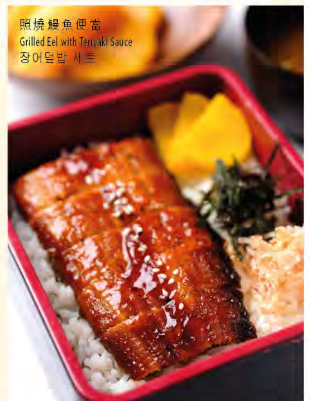
照燒鰻魚便當 Grilled Eel with Teriyaki Sauce 장어덮밥 세트