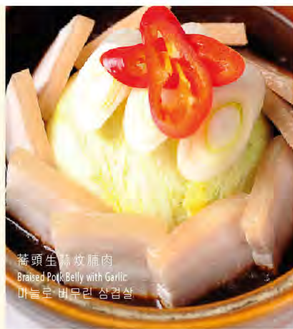
蕎頭生蒜炆腩肉 Braised Pork Belly with Garlic 마늘로 버무린 삼겹살