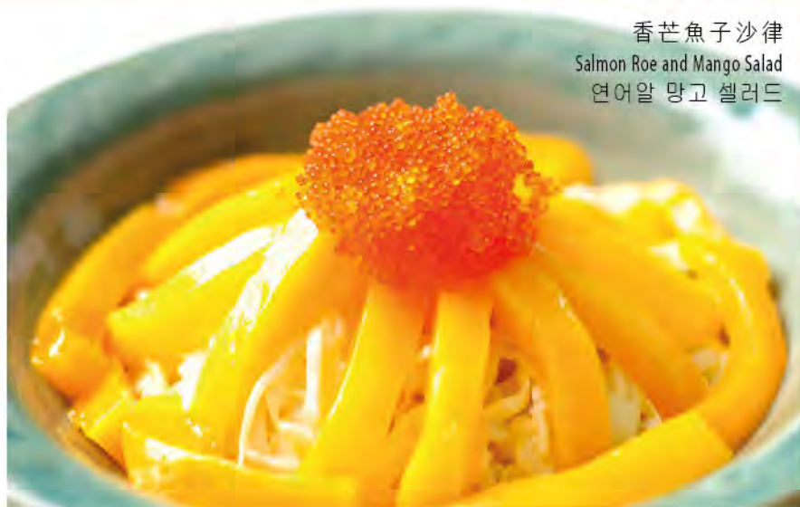
香芒魚子沙律 Salmon Roe and Mango Salad 연어알 망고 샐러드