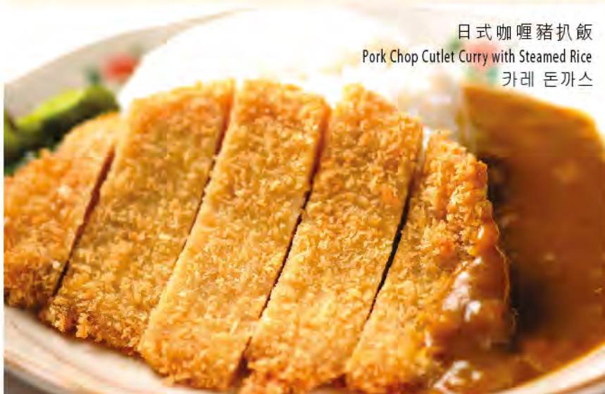
日式咖喱豬扒飯 Pork Chop Cutlet Curry with Steamed Rice 카레 돈까스

以上價格為澳門幣並需另加10%服務費 All prices are in MOP and subject to 10% service charge 모든 금액은 마카오 달러이며 10%의 봉사료가 추가 됩니다.