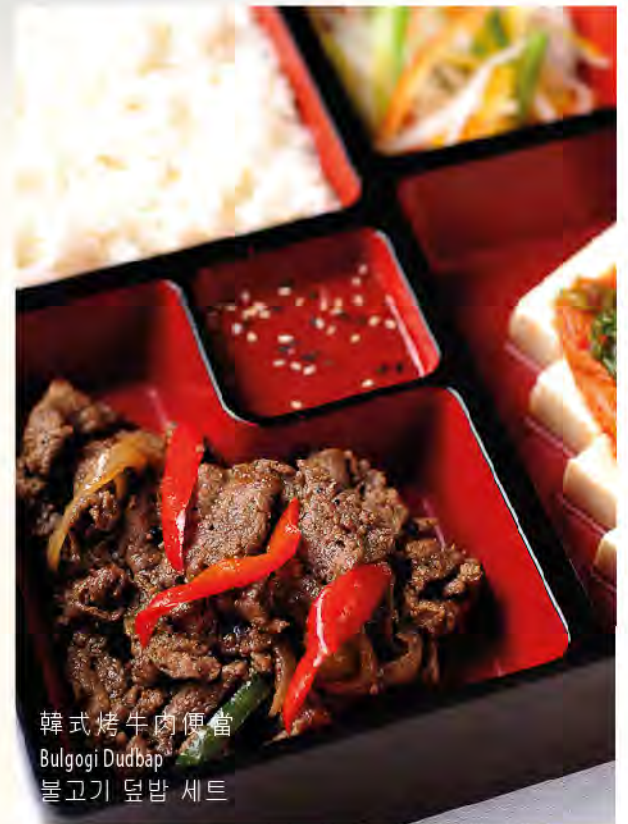
韓式烤牛肉便當 Bulgogi Dudbap 불고기 덮밥 세트

以上價格為澳門幣並需另加10%服務費 All prices are in MOP and subject to 10% service charge. 모든 금액은 마카오 달러이며 10%의 봉사료가 추가 됩니다.